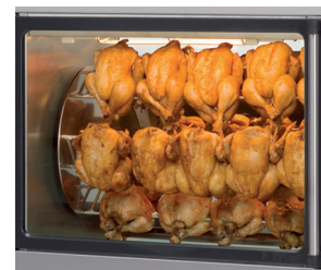
Grande section de présentation