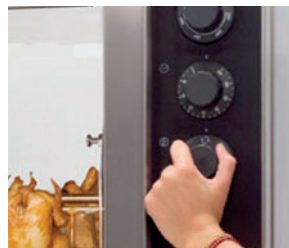
Bouton de rotor