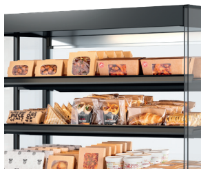
Nahrungsmittel (buchstäblich) im Rampenlicht - LED-Beleuchtung über jedem Fach.