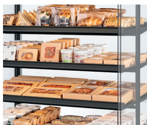
Ultimative Produktsichtbarkeit - transparentes Design, schlanke Regale, keine Ablenkung.

Weitere Vorteile des MDD finden Sie auf frijado.com